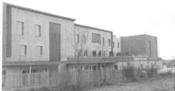
Ehpad Le Val De Moine - Cholet