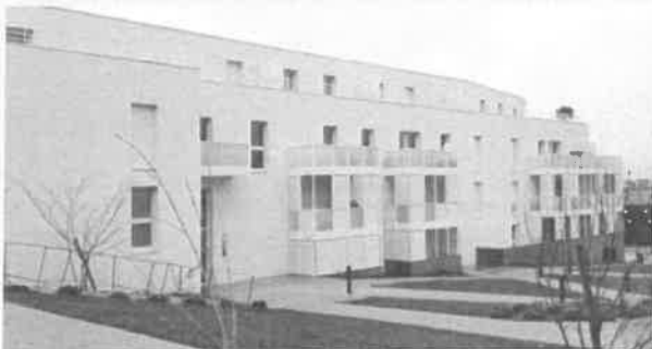
Ecrin nature - logements