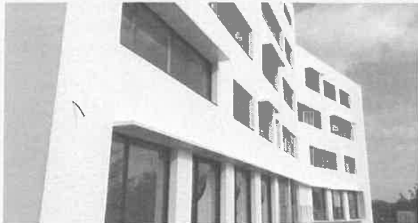
Yelo - bureaux