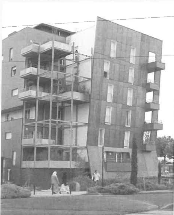
Tilleuls - logements