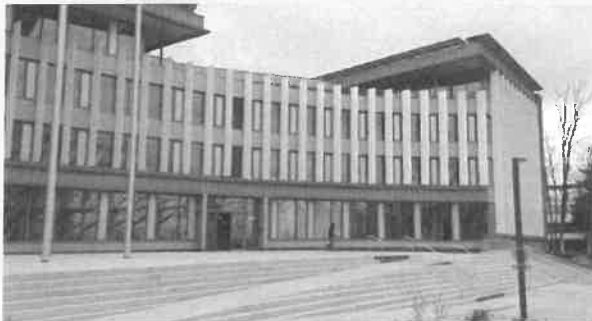
Deltagreen - Bureaux