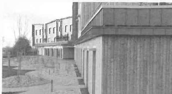
Ehpad Le Val De Moine - Cholet