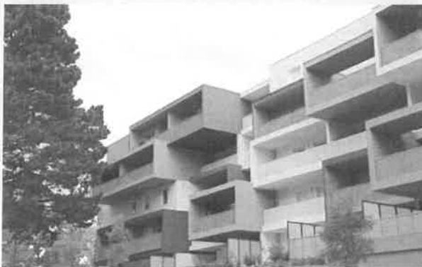
Eden vallée - logements